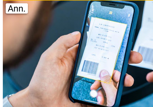
Conto business online