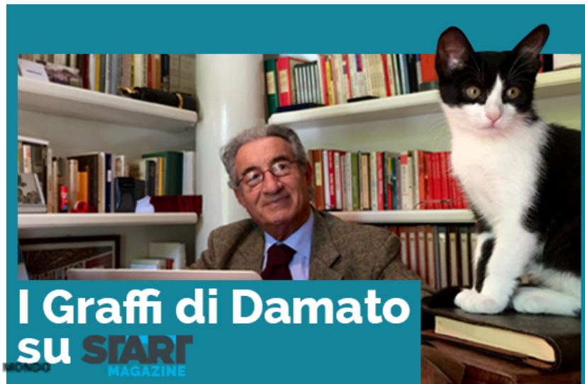
Il doppio giochetto di Renzi fira Pd e M5S