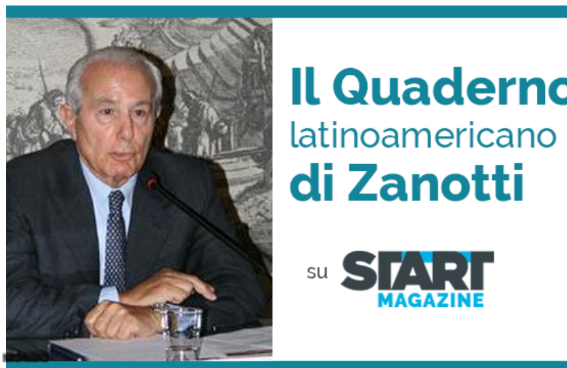
Perché la tragedia del Messico è a una svolta