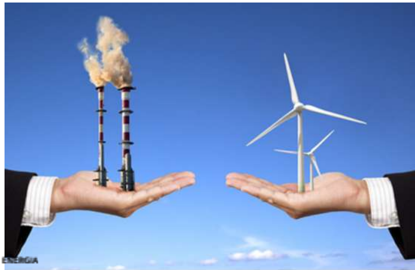
Quali sono le vere ambizioni green dell'Europa?