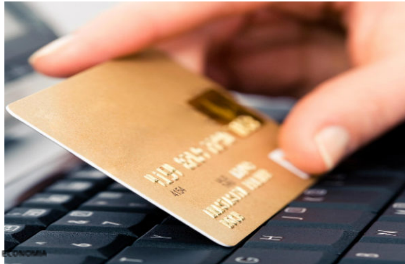
Perché l'Intesa Sanpaolo e Abi sbruffano sul progetto franco-tedesco Epi (anti Visa e Google Pay)