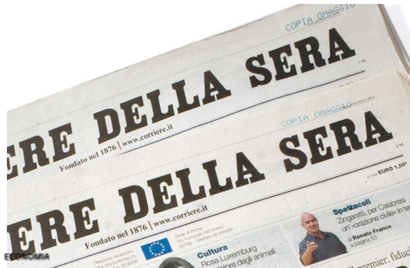
Il Corriere della Sera di lunedì Intesa Sanpaolo sull'Ops per papparsi Ubi