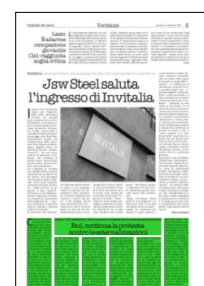
Superficie 25 %

ARTICOLO NON CEDIBILE AD ALTRI AD USO ESCLUSIVO DEL CLIENTE CHE LO RICEVE - 6640