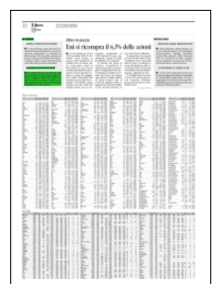
Superficie 1 %

ARTICOLO NON CEDIBILE AD ALTRI AD USO ESCLUSIVO DEL CLIENTE CHE LO RICEVE - L.1737 - T.1752