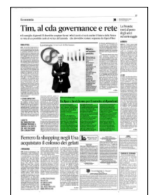
Superficie 10 %

ARTICOLO NON CEDIBILE AD ALTRI AD USO ESCLUSIVO DEL CLIENTE CHE LO RICEVE - L.1737 - T.1622