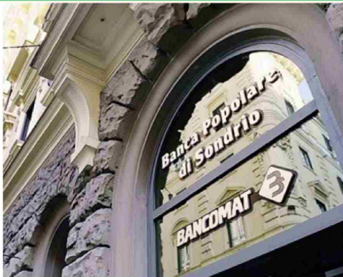
La Pop Sondrio in Bergamasca conta una trentina di filiali