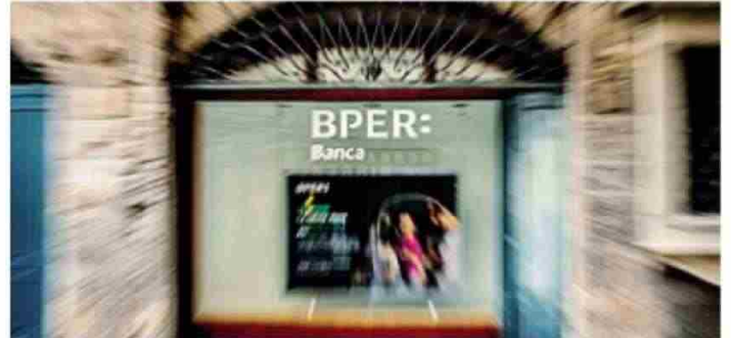
Filiale Bper sulla Corsarola in Città Alta